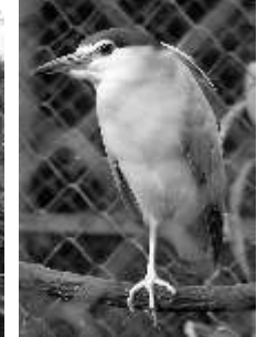
Gambar : Telur, juvenil dan burung dewasa

Salah satu momen menarik untuk mengamati burung kowak-malam abu ini adalah saat mereka pergi menuju habitat makannya. Ribuan burung ini terbang dalam beberapa kelompok saat hari beranjak gelap (mulai pukul 18.00 dst).