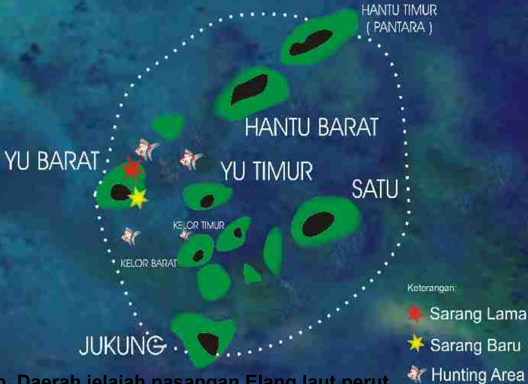
b. Daerah jelajah pasangan Elang laut perut putih di P.Yu