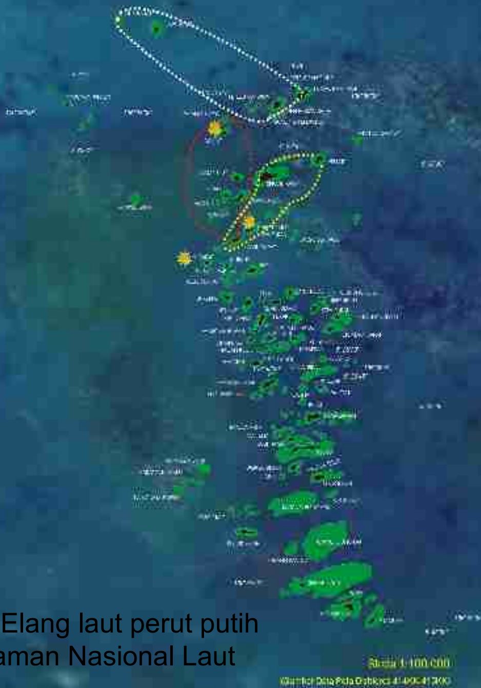
Peta sebaran Elang laut perut putih di kawasan Taman Nasional Laut Kep. Seribu

Skala 1:100.000 Warta Data Peta Digital 4: 195-1700